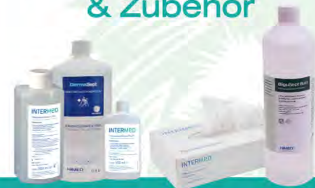
Haut / Hände